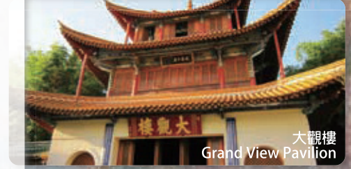
大觀樓 Grand View Pavilion