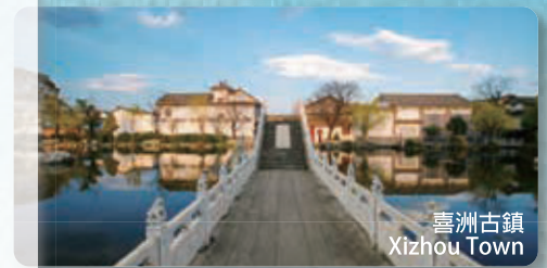
喜洲古鎮 Xizhou Town