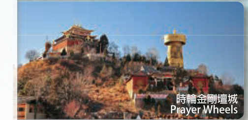
時輪金剛壇城 Prayer Wheels